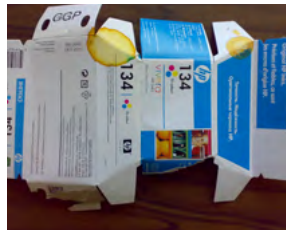
Prodotti illeciti sequestrati in Italia